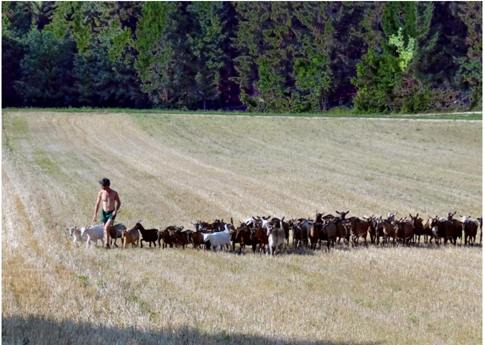
Der Hirte vom Ziegenhof Loretto mit seinen Tieren auf einem Stoppelfeld oberhalb von Zwiefalten.

Körschtal zurück nach Stuttgart geht. Bitte kleines Vesper und Getränk mitnehmen.