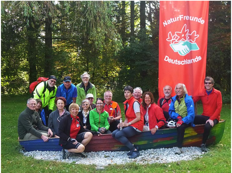
Die Radgruppe im Naturfreundehaus Weilheim.