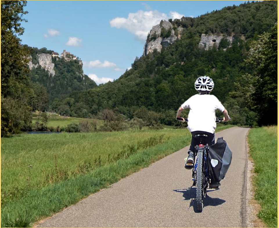
Große Sommerradtour im letzten Jahr: oberes Donautal

und Enz entlang bis Bietigheim. Eine etwas schwierige Stelle bei Thalheim werden wir gemeinsam meistern. Einkehr in dem sehr schönen Biergarten der Rommelsmühle. Bitte Vesper und Trinken mitbringen.