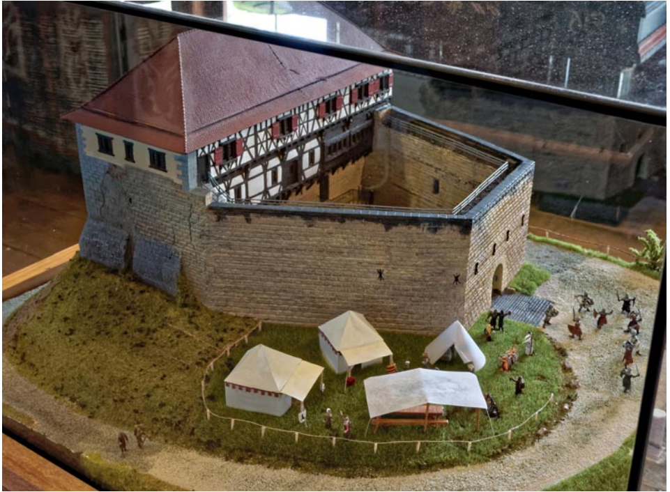
Das Wäscherschloss als Modell, in dem sehenswerten kleinen Museum im Obergeschoss.

VVS oder auf Wunsch Weiterfahrt nach Stuttgart. Bitte Vesper und Getränke mitnehmen.