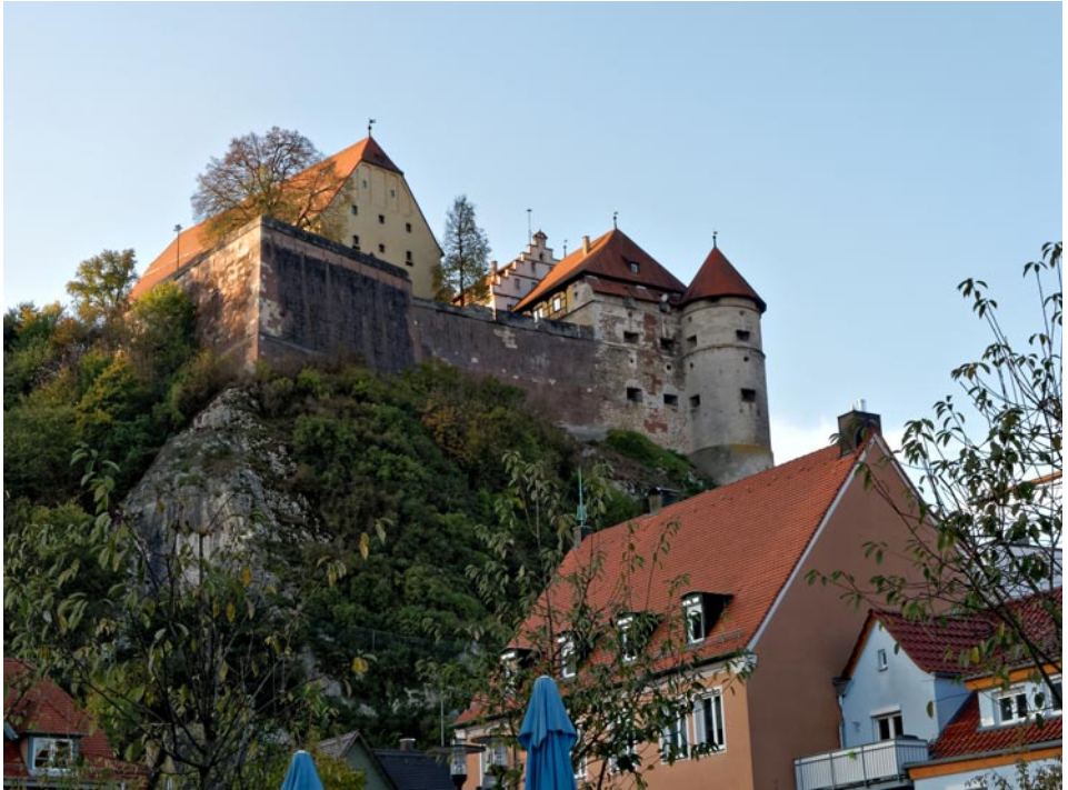
Schloss Hellenstein thront über Heidenheim.

Rucksackverpflegung. Einkehr zum Schluss. Bei schlechtem Wetter Museumstour nach Karlsruhe-Durlach. Genaue Infos zeitnah im Internet.